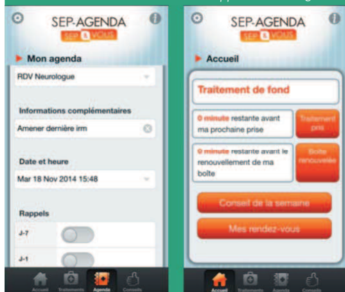
2 - Illustration des fonctionnalités de l'application SEP Agenda

La section dédiée aux rendez-vous est relativement classique. L'utilisateur peut saisir les dates des prochains rendez-vous chez les différents acteurs (neurologue, kinésithérapeute, etc...) ainsi que des notes de rappel (examens à faire et à apporter...). Là encore, une alarme de rappel pourra être envoyée si l'utilisateur le demande.